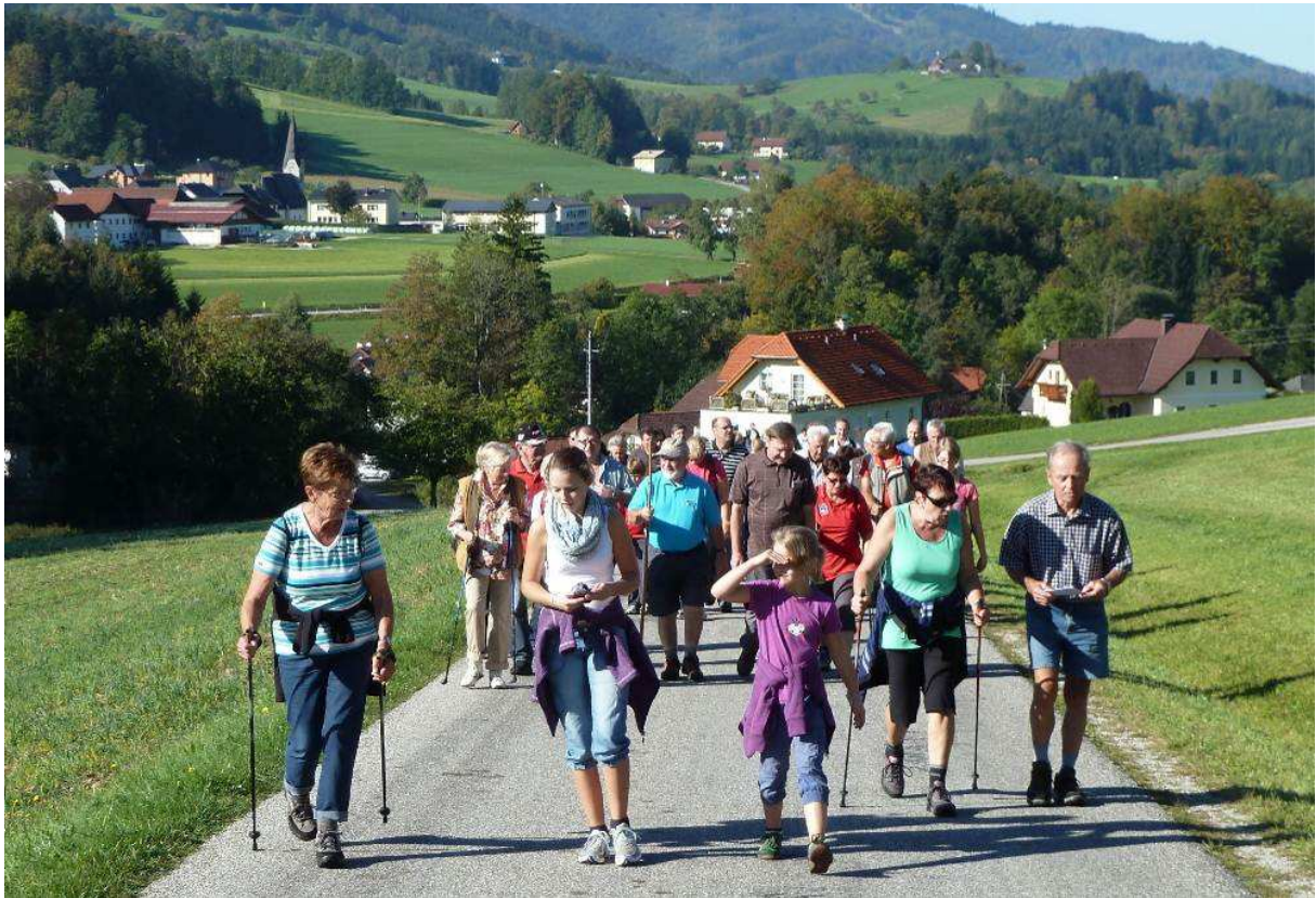
Foto 4: Die erste „Bergwertung“ – im Hintergrund das Ortszentrum von St. Konrad.