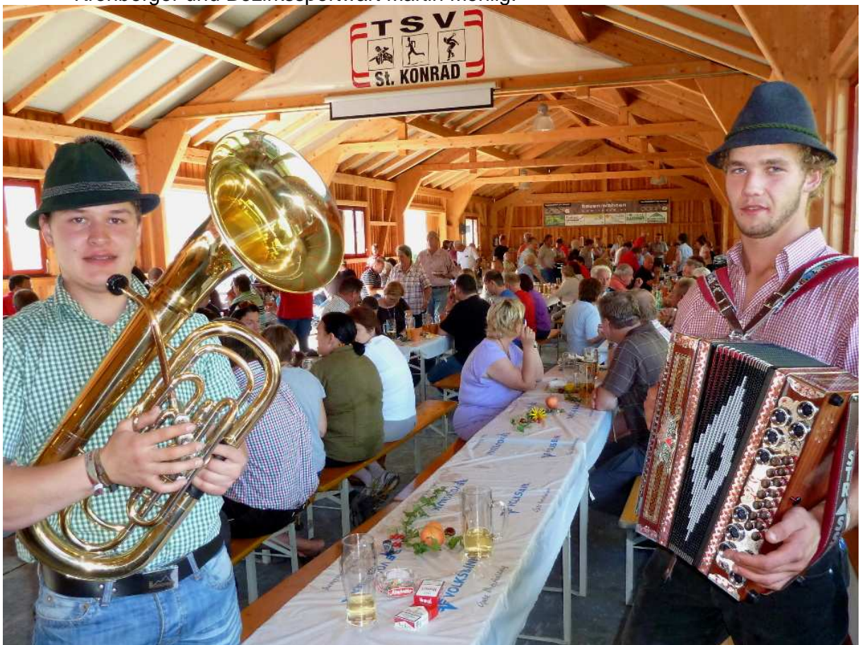
Foto 10: Für die musikalische Umrahmung sorgen die Flachberg-Buam.