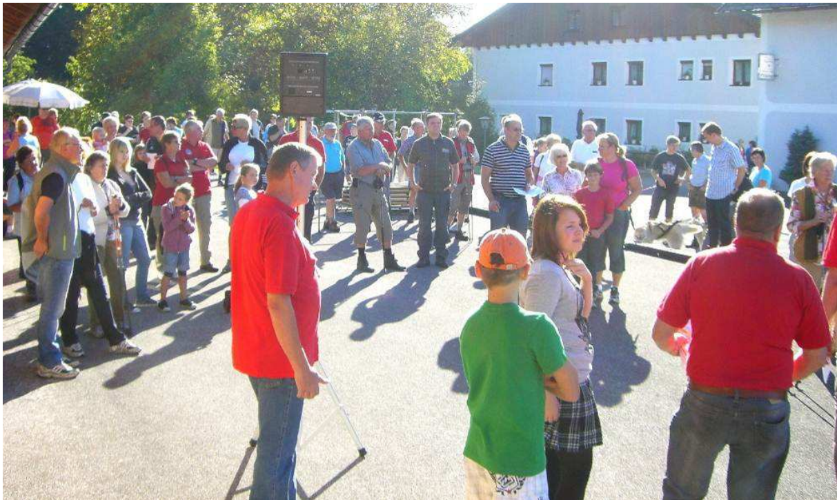
Foto 1: Ein Großteil der Teilnehmer vor dem Start bei der TSV-Stocksporthalle.