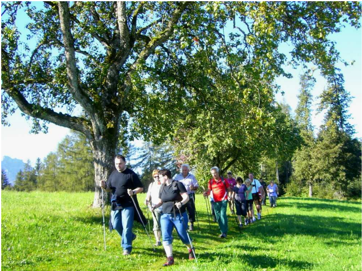
Foto 7: Eine Wanderung mit einem faszinierenden Farbenspiel der Natur.