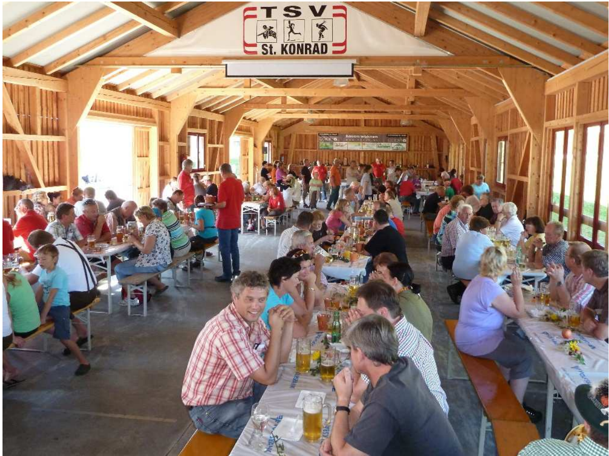
Foto 11: Gute Stimmung beim Abschluss in der TSV-Stocksporthalle.