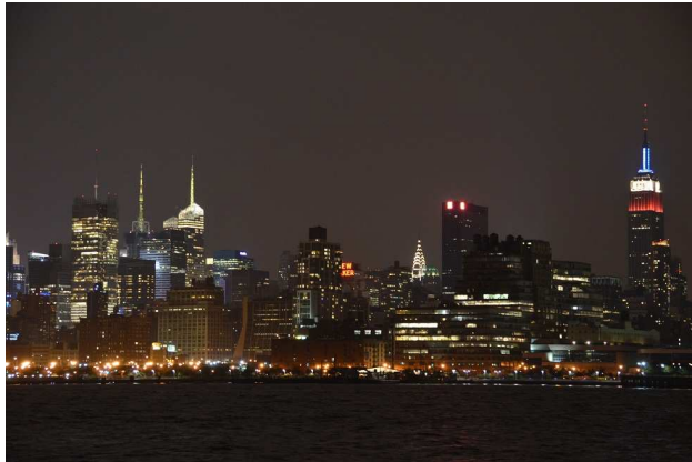
(Skyline von New York City bei Nacht)

Für uns war es trotz mancher Turbulenzen eine gelungene Veranstaltung und wir sind mit unseren Leistungen und den erkämpften Medaillen vollauf zufrieden. Wir sind der Überzeugung, unsere Gönner entsprechend zufrieden gestellt und den LPSV OÖ, die österreichische Polizei und den Staate Österreich würdig vertreten zu haben.