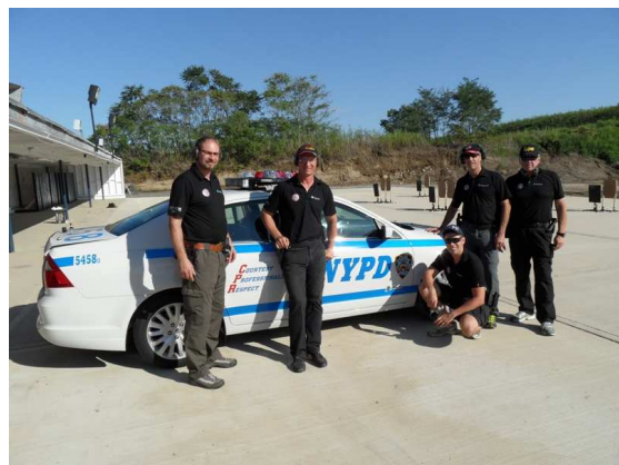
(Hohensinn-P., Post, Oriol, Hochh., Parzer, v.l.n.r.)