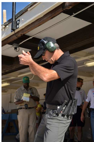
(Walter in Vorbereitung)

War es kurz vor unserer Anreise noch die Meldung über ein Erdbeben mit Epizentrum im Bereich Washington und Ausläufern nach New York gewesen, so wurde schon am Tage der Eröffnung von einer neuerlichen Naturkatastrophe gewarnt. Ein Hurrikan mit dem Namen „Irene“ hatte sich über dem Atlantik gebildet und zog direkt auf New York zu. Einige Sportler erfuhren bereits kurz nach der Eröffnungsfeier, dass deren Sportbewerbe vorläufig oder gleich ersatzlos gestrichen wurde. Obwohl der Wirbelsturm dann gottlob nur in abgeschwächter Form am Samstag (27.8.2011) eintraf, legt er doch das öffentliche Leben in New York City vorübergehend lahm. Brücken und Tunneln wurden gesperrt, der öffentliche Verkehr wurde eingestellt und neben einer fast 48-stündigen Berichterstattung über den Hurrikan wurde auch von Hamsterkäufen berichtet.