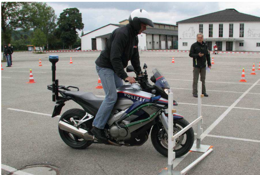
Foto 6: Gelungener Stopp – vor dem Abstieg darf nur die untere Latte fallen !