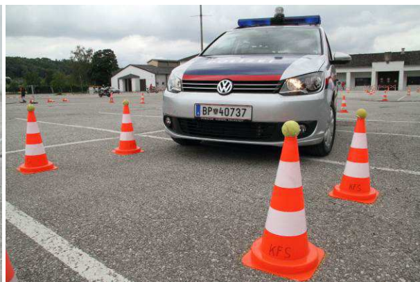
Foto 7 und 8: Schnelligkeit ist am PKW-Parcours gefragt – das Berühren oder Umfahren von Pylonen bringt jedoch Strafsekunden !