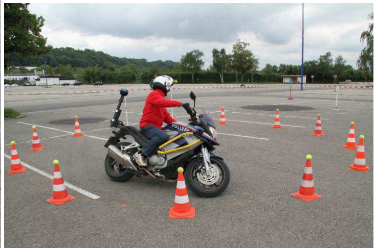
Foto 2: In der „Spurgasse“ darf kein Brett berührt werden. Foto 3: Viel Geschick erfordert das Fahren im Kreis.