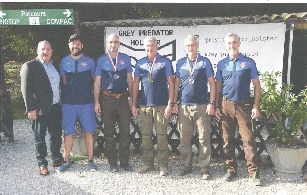
OÖ Polizei-LM PPS - Siegerehrung Senioren 1