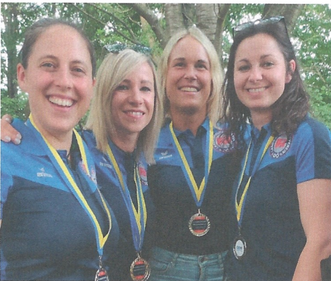
BPM2023 - erfolgreiches Damen-Team LPSVOÖ